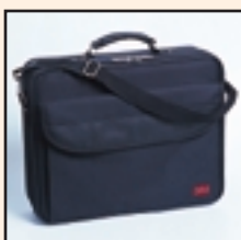
Sacoche de transport en option